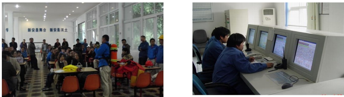
图 1 安全培训及生产现场图片

安全知识培训、开展安全比赛，强化全员安全意识，降低事故发生率。针对生产过程中遇到的各类安全状况，各事业部制定了详细的管理规定、操作规程及预案定期对车间进行 6S 安全检查，并及时记录安全隐患。